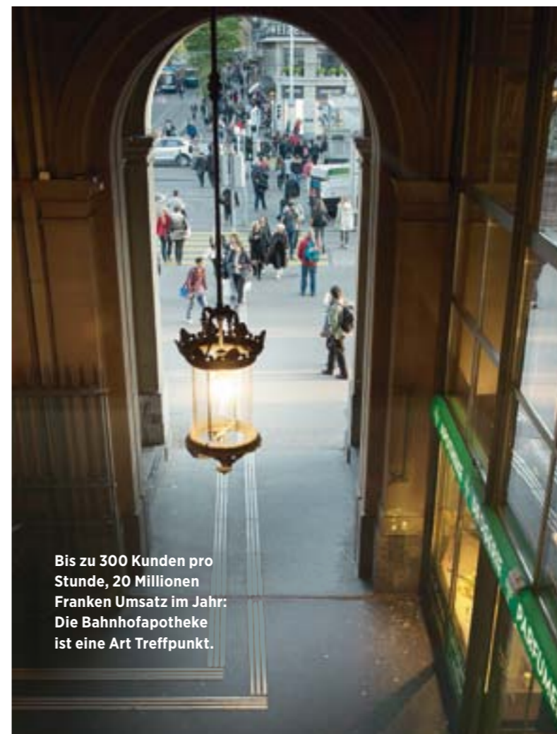
Bis zu 300 Kunden pro Stunde, 20 Millionen Franken Umsatz im Jahr: Die Bahnhofapotheke ist eine Art Treffpunkt.