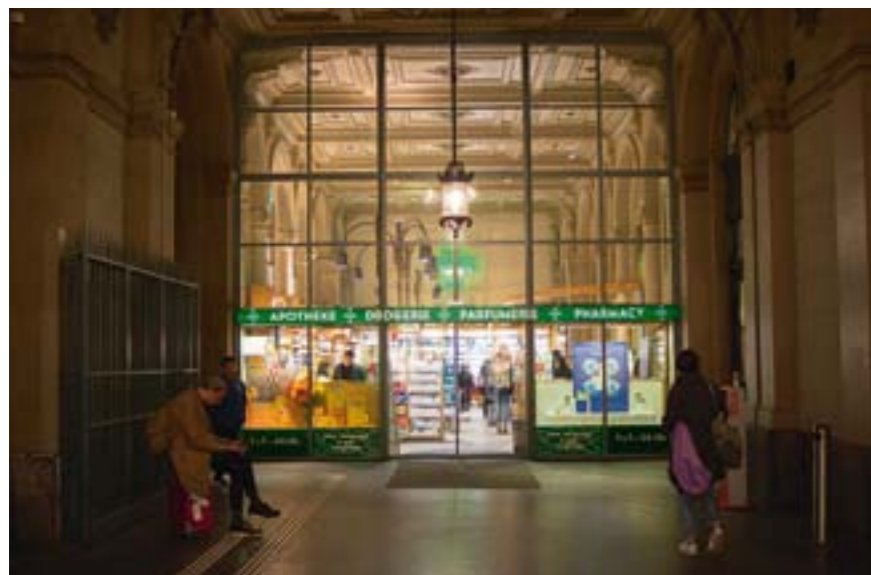
Junkies und Alkoholiker: Die Stammkundschaft am Abend mag kein Publikum.

Paracetamol und Ibuprofen werden am häufigsten verkauft. Rund 10 000 Packungen im Monat – 325 jeden Tag.